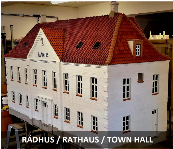
RÅDHUS / RATHAUS / TOWN HALL